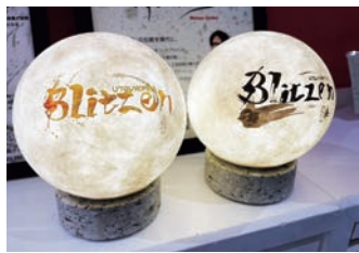
①廣瀬 GM (左) と西村専務取締役 (右)、②わたやとブリッツェンのコラボ提灯